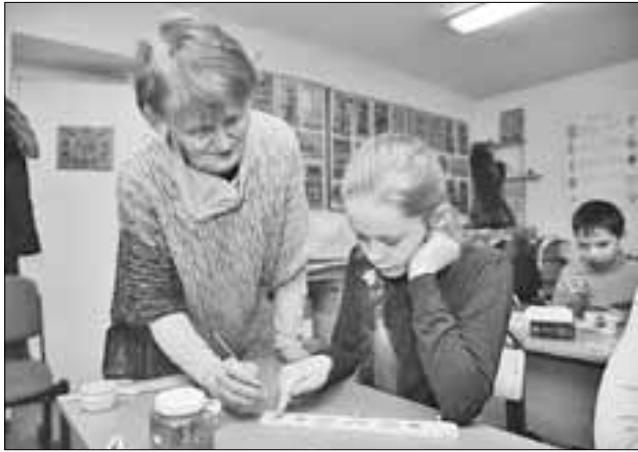
■ Детей обучают художественной росписи Русского Севера