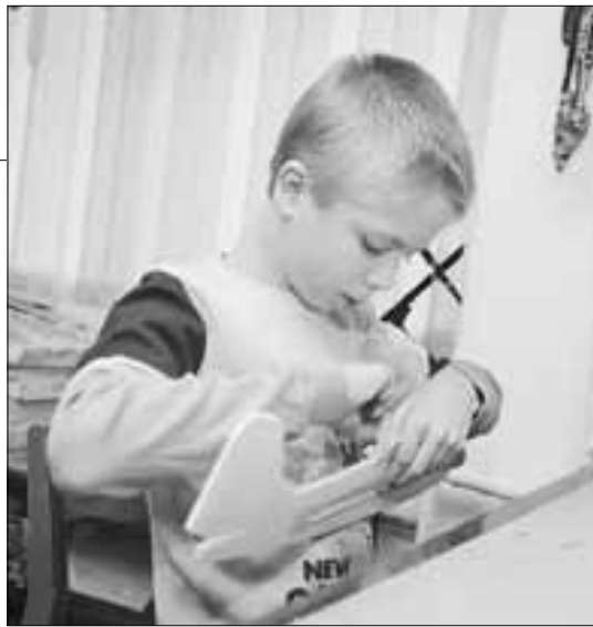
■ Одно из самых трудных и материально затратных, но очень интересных направлений – авиамоделирование