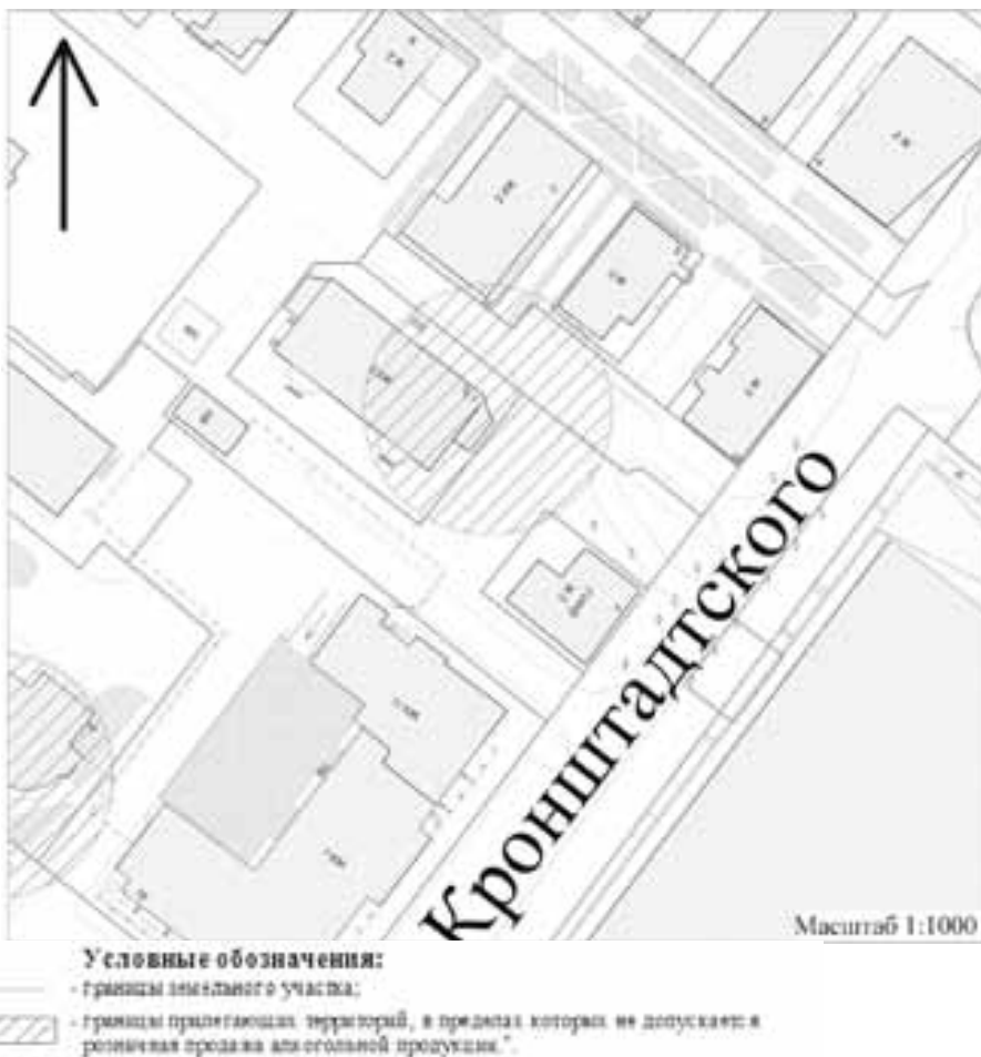
Схема № 14 границ прилегающей территории медицинской организации, расположенной по адресу: Архангельская область, г.Архангельск, пр.Чумбарова-Лучинского, д.7, корп.1

УТВЕРЖДЕНА постановлением мэрии города Архангельска от 07.04.2014 № 278